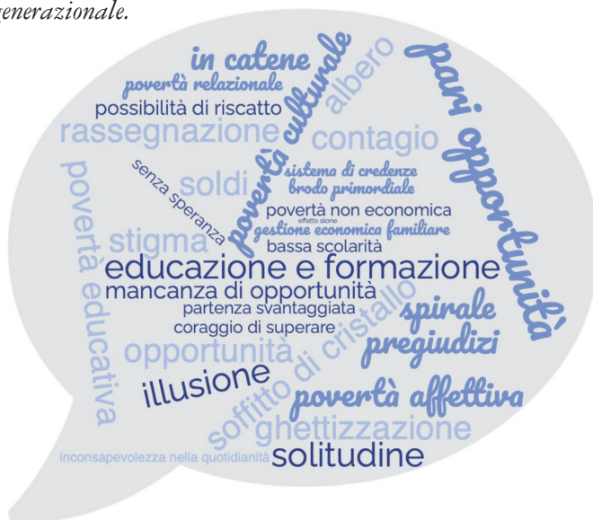
Figura 1. Le parole citate da operatori e volontari delle Caritas per definire la povertà intergenerazionale.

Gli operatori e i volontari delle Caritas lombarde hanno descritto la povertà intergenerazionale attraverso una parola evocativa. Emerge un quadro in cui prevale la rassegnazione dei beneficiari, la consapevolezza di operatori e volontari rispetto a quanto sia difficile spezzare la catena di trasmissione della povertà da una generazione all'altra.