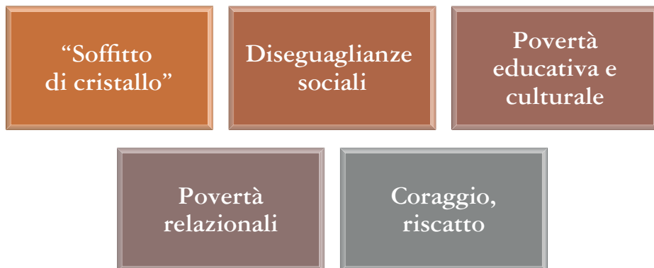
Figura 2. Le aree tematiche della percezione della povertà intergenerazionale.

Nella drammaticità del quadro, appare subito uno squarcio di speranza e di desiderio di operatività, dovuto forse anche al fatto che il tema è stato più presente nel dibattito nazionale e probabilmente ha favorito riflessioni tese a trovare soluzioni possibili.